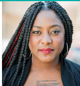
Los Fundadores de Black Lives Matter Alicia Garza and Patrisse Cullors