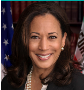
Senadora Kamala Harris