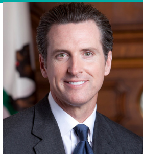
Gobernador Gavin Newsom